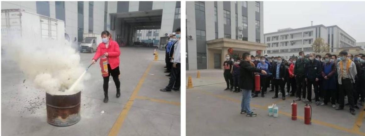
图 6.3-01 2023 年应急演练记录

等的熟知程度和实战能力；以便预案各种应急程序进一步掌握，磨合各应急工作组应急响应和协同应急处置能力。锻炼事故状态下，事故的有效收集和处置能力。测试公司应急响应和应急处置时间，暴露存在的问题，以便进一步完善应急预案和配备应急所需的设备器材。公司每年都会各类应急预案进行每年举行火灾消防、管道泄漏等各种应急预案的演练，演练后我们都会安排《应急演练评价》，总结演练，提出改进建议，不断地完善应急预案，更好地预防事故发生后应急措施的落实和有效性。